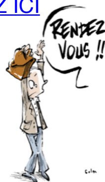
RENDEZ-VOUS DE CARRIÈRE